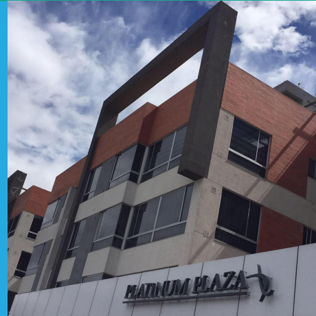
Edificio PLATINUM PLAZA