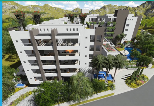
Edificio KIRO CUMBAYA