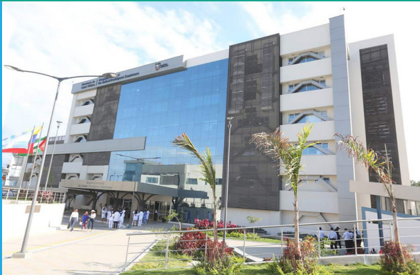
Reconstrucción HOSPITAL RODRÍGUEZ ZAMBRANO